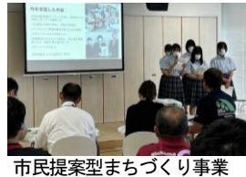
市民提案型まちづくり事業 公開プレゼン