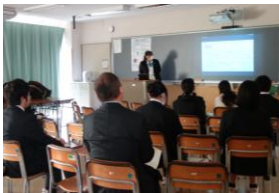
夢 Pro 1 年次発表

夢 Pro を通じて得た知識や経験は、生徒たちを魅力的な高校生へと成長させていると感じています。今後も、生徒の胸が高鳴る活動に取り組み、生徒の夢の実現に向かっていきます。