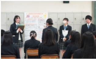
夢 Pro 2 年次発表