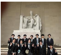
アメリカ短期研修の様子

ドーバー高校との交流以外にも、角田市の姉妹都市であるインディアナ州グリーンフィールド市との交流会や、県内在住の外国人の方や留学生を招いての交流などが盛んに行われているのも特徴です。また、令和 3 年度から中国浙江省寧波にある城南中学と友好校締結をし、オンラインで交流しています。