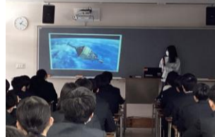
JAXA 新人職員による講演会