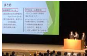
夢 Pro 2 年次発表