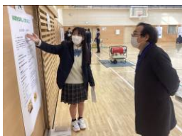
夢 Pro 1 年次ポスター発表

夢 Pro を通じて得た知識や経験は、生徒たちを魅力的な高校生へと成長させていると感じています。今後も、生徒たちとともに胸が高鳴る活動に取組み、生徒の夢の実現に向かっていきます。