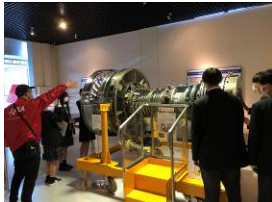
サイエンス研修の様子