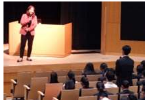
JAXA 宇宙教育センター長による講演会