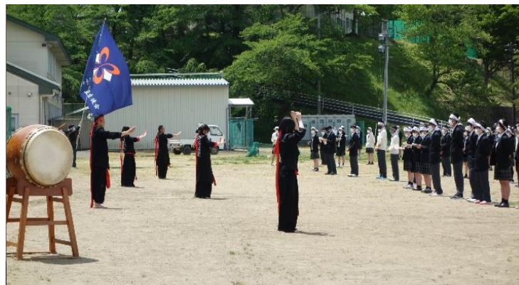
校庭での応援練習を指揮する応援団)