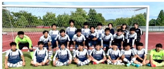
定期戦で奮闘する卓球部(上)とサッカー部(下)