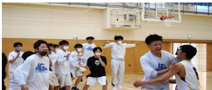
終了間際に逆転のシュートを決め、喜ぶ男子バスケットボール部