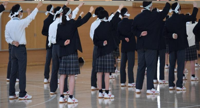
応援練習を行う生徒たち