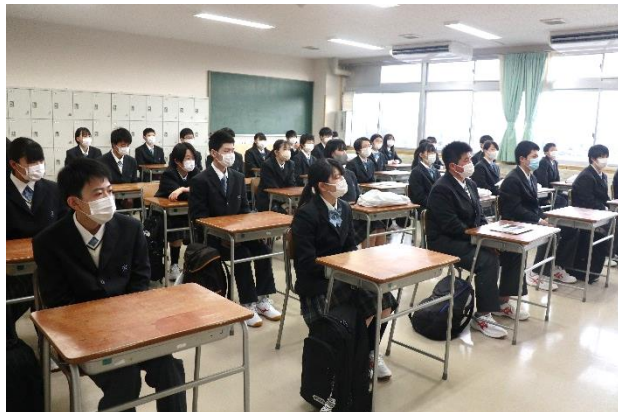
最初のホームルーム