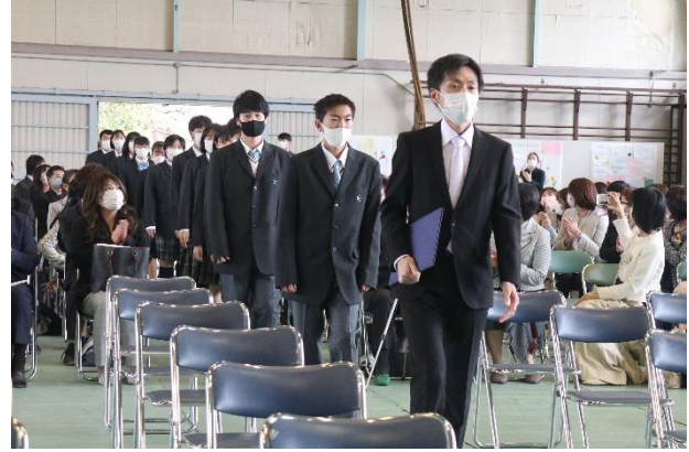
緊張した面持ちで入場