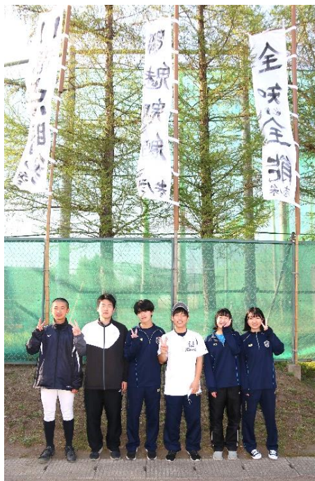
自分たちの作成した幟の前でポーズ