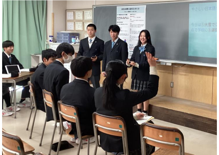
<やさしい日本語について>