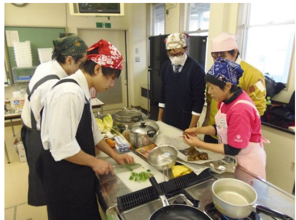
指導を受けて調理する男子生徒

12月7日(木)に角田市食生活改善推進員協議会の方を招いて食生活改善セミナーが開かれました。家庭部の生徒と3年生のうち進路が決まった生徒が参加し、豚汁と鰯丼を作りました。最初に食事と栄養に関する話があり、その後グループに分かれて調理を始めました。日頃はあまり包丁を握ることのない男子生徒もエプロンとバンダナをまいて慣れない手つきで調理していました。なかには初めて鰯の手開きに挑戦した生徒もいました。たくさんできあがったために、職員室にいる先生方呼んできて試食してもらいました。先生方の中には食べ過ぎて夕食を抜いた人もいました。春より一人暮らしをすることが決まっている3年生にとっては良い予行演習になったと思います。